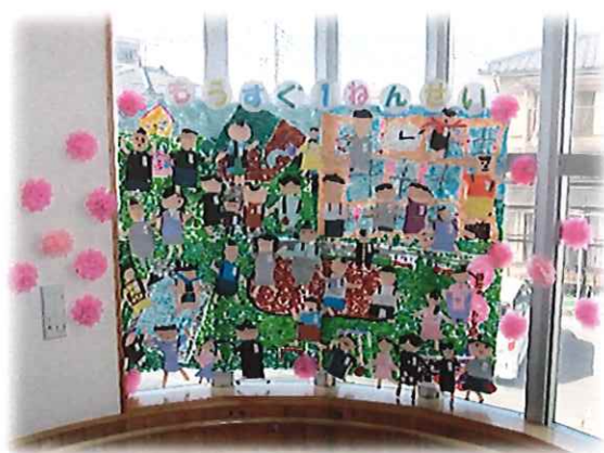
一年生の自分を作りました