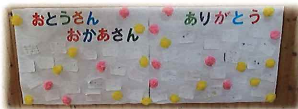
卒園児からのメッセージ