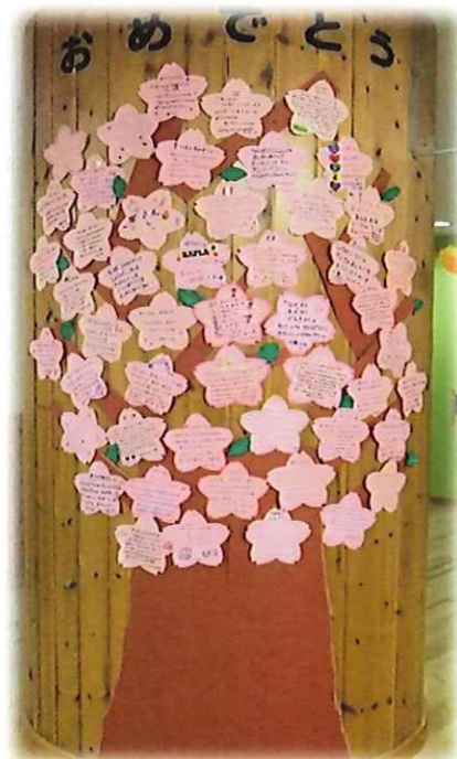
職員から心のこもったメッセージ