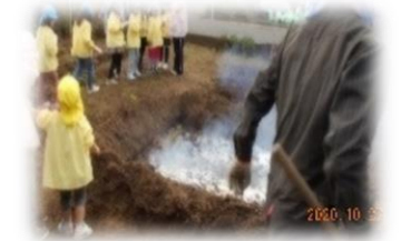
お芋は、園長先生、給食先生が火の中に入れました。