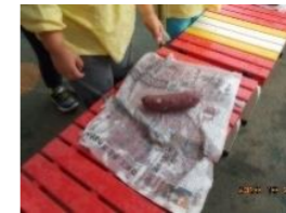
10/27(火)焼きいも大会 新聞とアルミホイルを まきまき