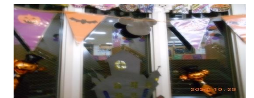
10/29の夜は、保育園はお化けだらけでした