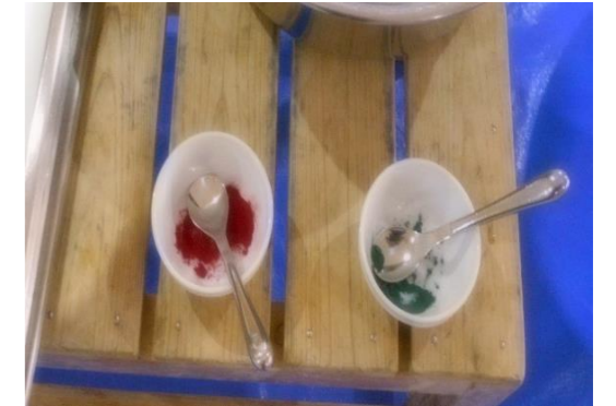
食紅(粉を混ぜてすぐに赤と緑の食紅で色を付け)