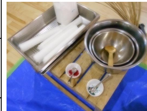
道具(粉は子どもたちの前で混ぜました)