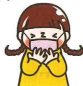
咳エチケットを守りましょう