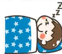
早寝早起きをしましょう