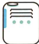
乾燥しないよう加湿器をつけましょう