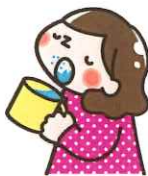
手洗い・うがいをこまめにしましょう