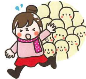
感染症にならないよう、人の多い場所は避けましょう